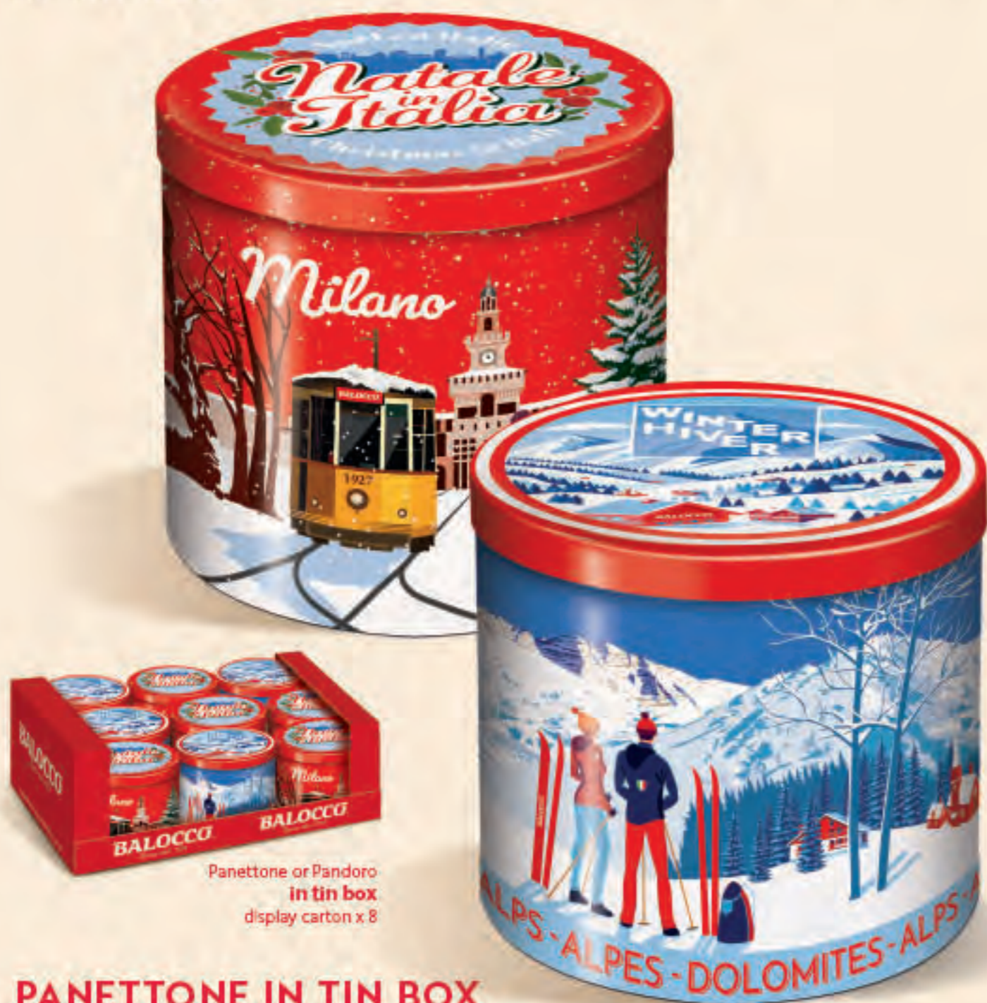
Panettone or Pandoro in tin box display carton x 8