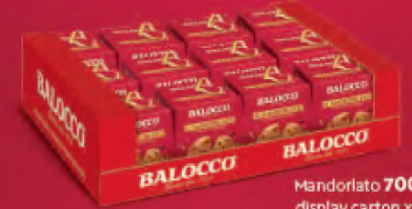
Mandorlato 700g display carton x 12