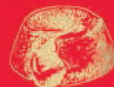
TORTINO CACAO E CIOCCOLATO

“Balocco interpretation of the most famous Italian cakes”