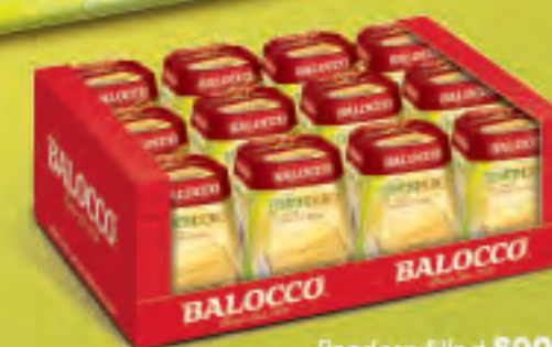
Pandoro filled 800g display carton x 12