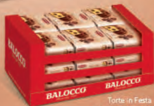
Torte in Festa display carton x 18